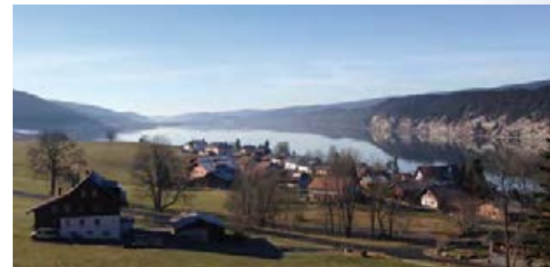
La vue sur le lac de Joux depuis le Grand Hôtel

En 1959, il est racheté par la « Société suisse des Auberges Familiales » ce qui permet à de