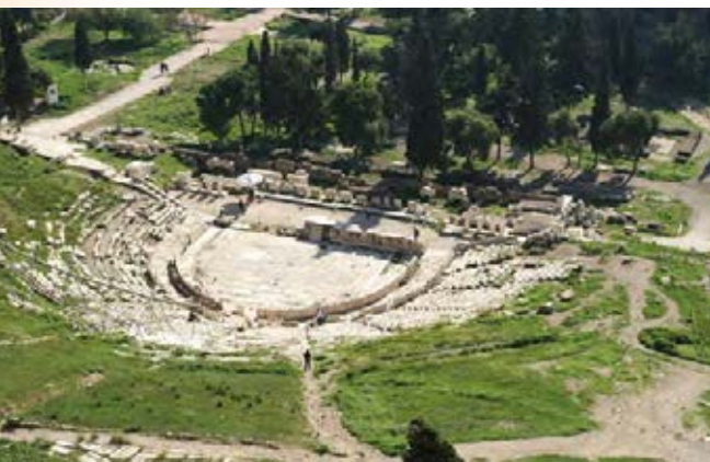
Les ruines du théâtre de Dionysos à Athènes